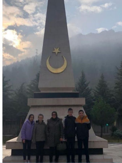
ÖĞRENCİLERİMİZLE ŞEHİTLİĞİ ZİYARET ETTİK